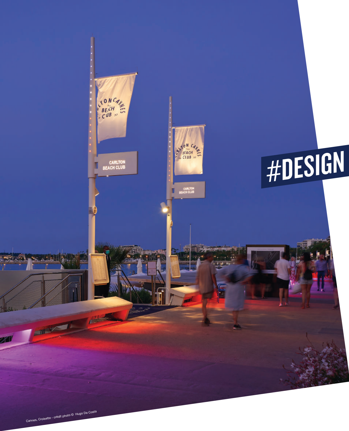
Cannes, Croisette