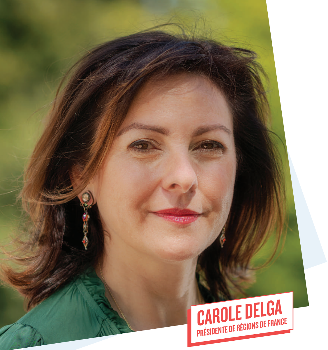
CAROLE DELGA PRÉSIDENTE DE RÉGIONS DE FRANCE